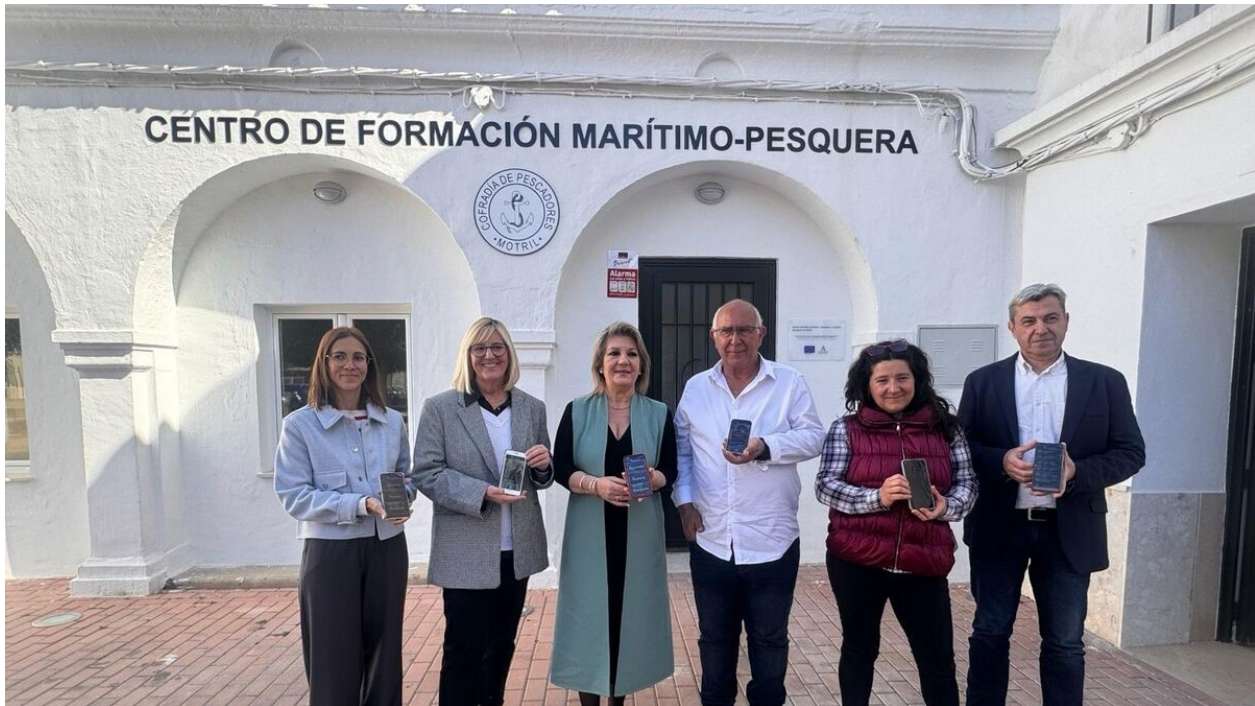
Durante la presentación de la aplicación